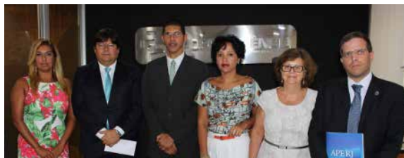
ADPERJ, AMAERJ, AMPERJ e APERJ se reuniram com o Rioprevidência, a fim de requerer as informações necessárias à elaboração de estudo atuarial da previdência das carreiras. A análise, além de levantar a real situação do Instituto, pretende traçar estratégias para retirar do Fundo Estadual seus aposentados e pensionistas.