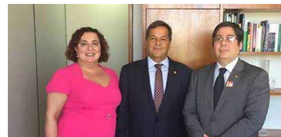
Deputado Sérgio Zveiter PODE (RJ).