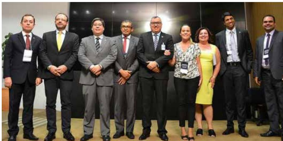
Ato em Brasília une carreiras do sistema de Justiça contra a Reforma.

Outras entidades classistas das carreiras das instituições congêneres, como a Frente Associativa da Magistratura e do Ministério Público (Frentas) e o Fórum Nacional Permanente de Carreiras Típicas de Estado (Fonacate), também estão unidas com a ANADEP, ADPERJ e demais Associações Estaduais, conseguindo apoios estratégicos dentro da Casa Legislativa na luta contra os prejuízos aos servidores públicos propostos pela Reforma.