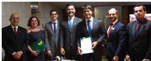
ADPERJ, ANADEP e Chefia Institucional se reuniram com deputados da bancada do Rio que fizeram parte da Comissão Especial montada para debater o projeto. A Associação Nacional também representou os Defensores em Audiência Pública na Casa.

Em fase de debate na Câmara dos Deputados, o PL 6726/2016, que regulamenta o teto do funcionalismo público para todos os Poderes, deve ser votado agora em 2018. De acordo com a proposta, os rendimentos recebidos não poderão exceder o subsídio mensal dos ministros do STF (R$ 33,7 mil). Ao longo de 2017, quando foi montada a Comissão Especial para debater a proposta, a ADPERJ, ANADEP e demais Associações Estaduais se reuniram com diversos parlamentares e entregaram ofício que destrincha os pontos do PL que atingiriam a categoria. O trabalho dos Defensores, que segue firme este ano, tem como foco retirar do texto do projeto as verbas de acumulação, os plantões diurnos e a indenização integral de férias ou licenças indeferidas.