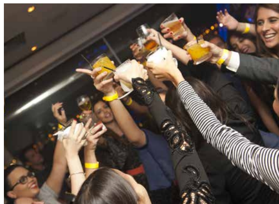
2016: Festa na cobertura do Praia Ipanema Hotel.