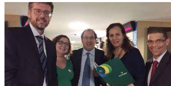
Deputada Jandira Feghali