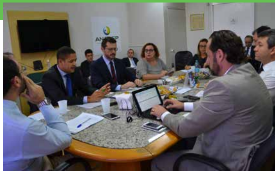
Diretoria da ANADEP e presidentes das Associações traçaram estratégias para barrar pontos importantes da Reforma. O trabalho conjunto marcou a gestão.

O grupo de Defensores Públicos se reuniu com bancadas, sensibilizou parlamentares, trabalhou temas importantes como o tratamento isonômico e a unicidade constitucional entre as carreiras