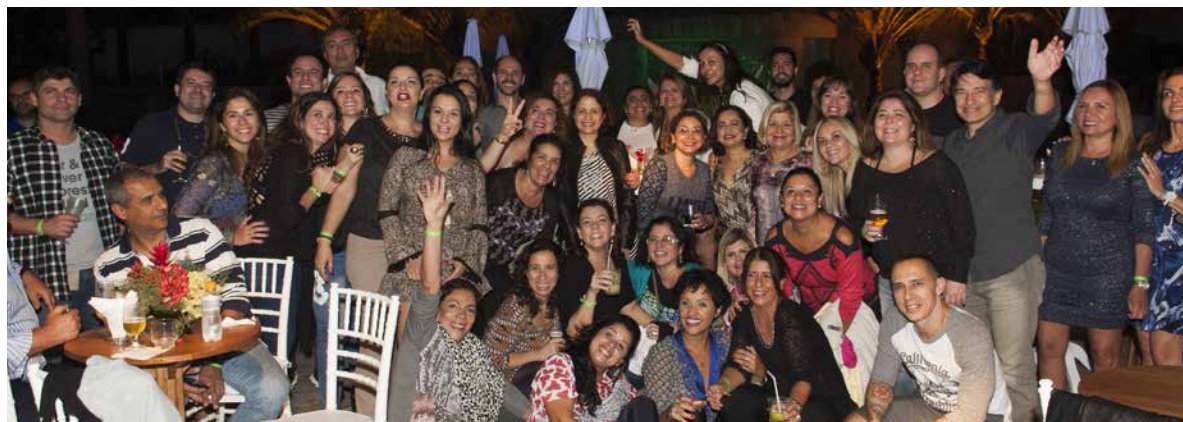
2017: ADPERJ uniu Encontro Estadual e Festa no Hotel Sheraton Barra, oferecendo um dia especial aos associados e suas famílias.