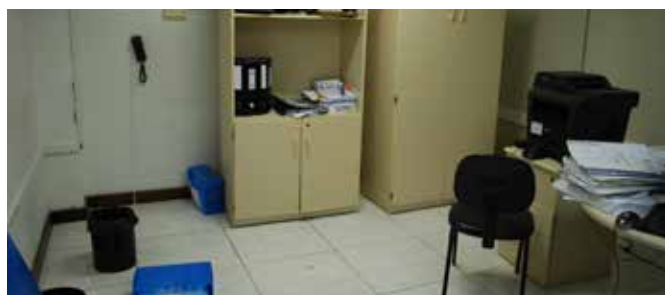
Sala aguardava móveis em Araruama