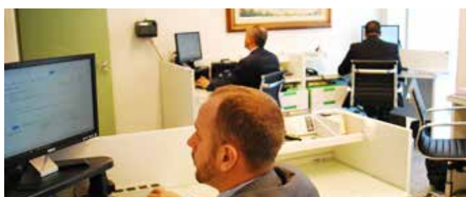
Administrativo da Associação vai trabalhar com novo programa