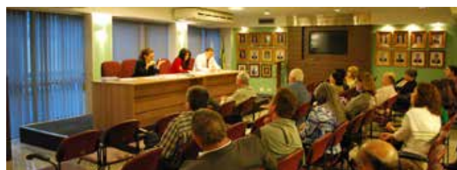
Debate de alternativas para a solução de processos da ADPERJ

Em AGE realizada no dia 04/09, além de traçar algumas estratégias para o julgamento da Ação Ordinária de Benefício de Permanência, também foi debatida a satisfação do crédito do Fundo de Reserva. Por conta da enorme dificuldade em conseguir os reais valores pagos pelos Defensores antes do ano de 1991, o escritório de advocacia contratado pela ADPERJ avalia a execução, por ora, da parte líquida do montante. Para chegar ao fim do impasse, a Associação também está tentando outras vias como a articulação feita junto à Deputada Martha Rocha, que protocolou na ALERJ o PL que prevê a devolução aos Defensores das contribuições vertidas em favor do Fundo em caráter indenizatório. ●