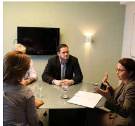
Reunião para renovação de contrato de convênio com Corretora de Seguros Westwhite Star do Brasil

A ADPERJ também quer conveniar o maior número de parceiros no interior do estado. Por isso, pedimos a ajuda dos Associados que estão fora da capital para que nos enviem o nome de empresas e a ADPERJ se compromete a tentar os descontos. É só enviar a dica para nosso e-mail adperj@adperj.com.br . ●