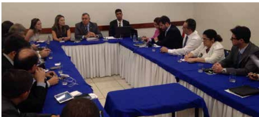
Afronta à autonomia institucional, advogados dativos e CNDP foram destaques de reunião em Goiânia