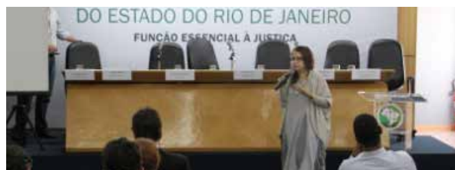
Associação mostra panorama da Defensoria no estado em audiência

No próximo dia 30/10, o Conselho Superior irá escolher, a partir de lista tríplice indicada pela sociedade civil, o próximo Ouvidor Geral da Defensoria Pública. O novo regulamento foi aprovado pelo CS em reunião aberta aos Colegas e depois apresentado aos representantes de movimentos sociais em audiência pública na sede da DPG. Em ambas as ocasiões, a ADPERJ esteve presente para assegurar que a atuação da Ouvidoria se baseie na promoção da qualidade do serviço da Instituição, como está prevista no artigo 105 – A da LC 80/94. ●