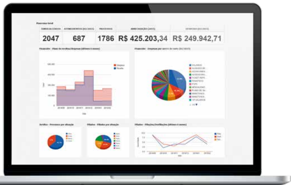
Novo software que integrará o administrativo da ADPERJ está sendo construído pela Moobi

O novo “coração” administrativo da ADPERJ está sendo construído pela empresa de tecnologia Moobi de acordo com nossas especificações classistas e estará em funcionamento até o final do mês. ●