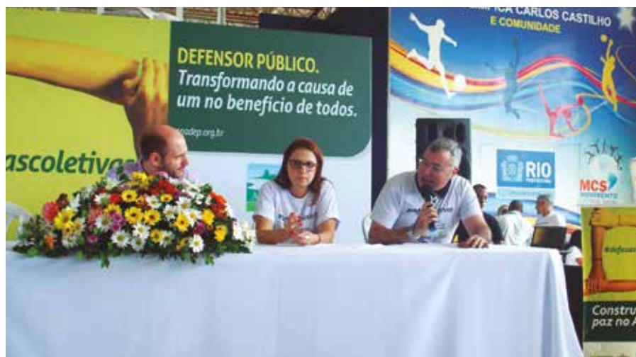
Presidente da ANADEP comemora a escolha do Alemão para lançamento da Campanha

Ponto alto da programação especial de maio leva atendimento e serviços sociais para comunidade