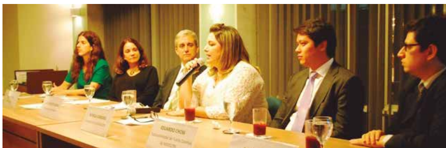
Casos exitosos estão em e-book disponível no site da ANADEP