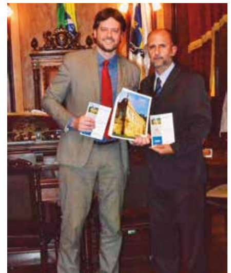
2º Sub-Defensor Geral, Rodrigo Pacheco