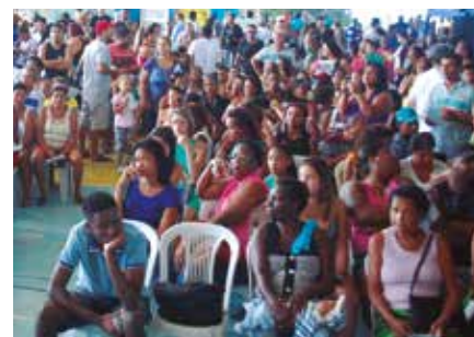
Na Audiência Pública, grupo pediu moradias prometidas pelo Estado

Além de atendimentos, serviços sociais e até exame de DNA feito na hora, a Defensoria Pública anunciou tam-