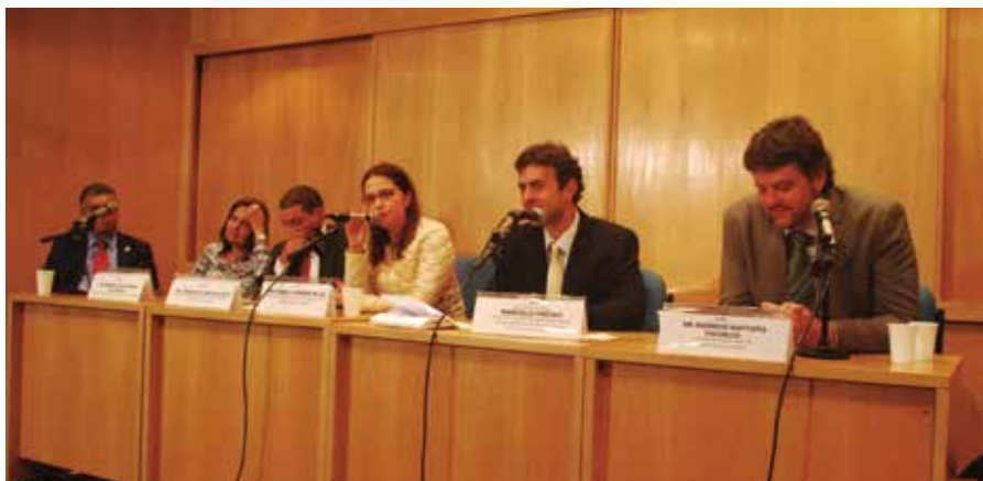
Presidente da ADPERJ agradece apoio suprapartidário às causas da Defensoria.