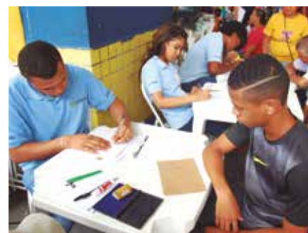
4 mil atendimentos foram feitos em um só dia

bém o resultado de acordos importantes realizados com a Light e Secretaria de Saúde.